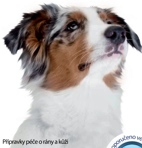
Přípravky péče o rány a kůži

za použití vyspělé technologie na bázi kyseliny chlorné (Advanced Hypochlorous Technology)